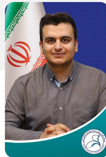
معاونت غذا و دارو